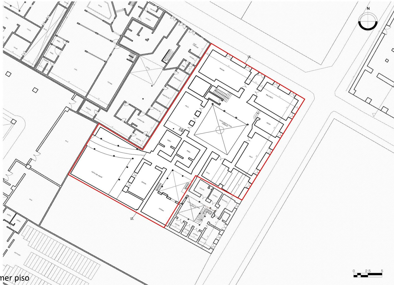
Planta primer piso